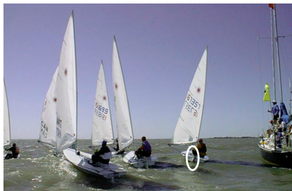
Wo schaut der Schiri beim Wriggen hin?

Gegen den ersten Teil der Regel verstoßen alle Handlungen, die eine Geschwindigkeitsänderung