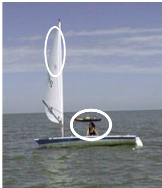
Wo schaut der Schiri beim Pumpen hin?

Die Anwesenheit von Schiedsrichtern auf dem Wasser wird immer normaler. In den letzten Jahren sind die Schiedsrichterboote immer kleiner geworden, so dass die Schiedsrichter mit dem Feld der Segler zusammen fahren und wie bei anderen Sportarten auch Entscheidungen sofort auf dem Wasser treffen können. Bei diesem Verfahren wird besonders auf Verstöße der Regel 42, Vortrieb, geachtet, die mit einer gelben Flagge und einem Schallsignal angezeigt werden.